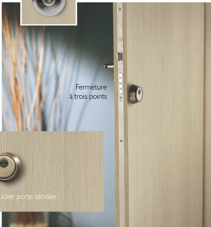
Fermeture à trois points