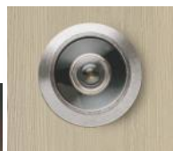
Judas grand angle