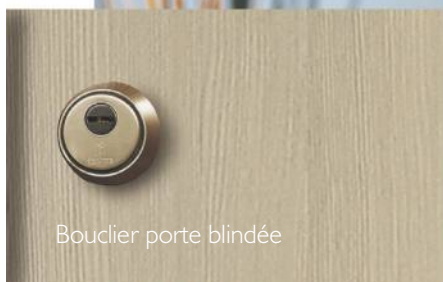
Bouclier porte blindée